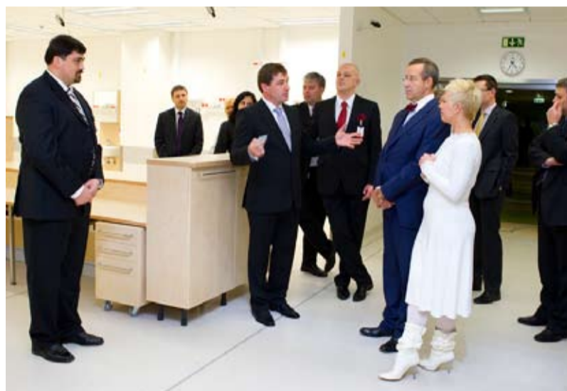
... ja erakorralise meditsiini keskuse.