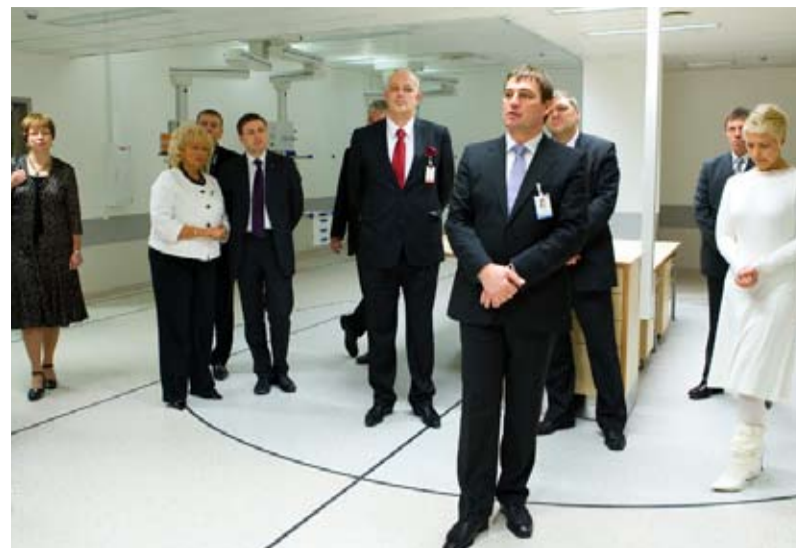
... intensiivravi keskuse, ...