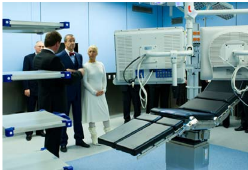
Ekskursioonid kulgesid läbi operatsioonikeskuse, ...