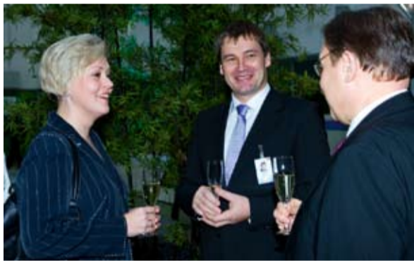
Riigikogu liige, endine sotsiaalminister Maret Maripuu.