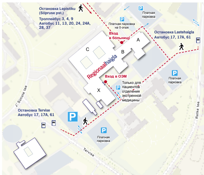
Схема прибытия в ОЭМ Региональной больницы