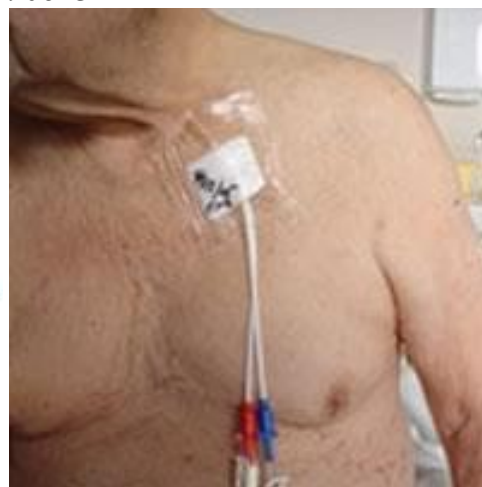
Рисунок 2. Крепление катетера Грошонга.