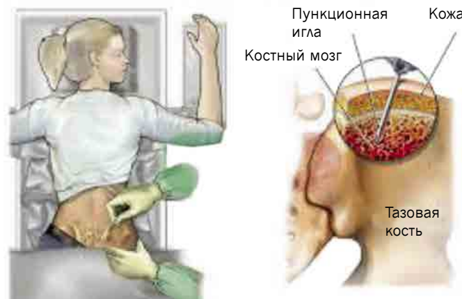
Аспирационная биопсия и трепанобиопсия костного мозга.

Некоторый страх и тревога перед исследованием – это нормально. Процедура, как правило, безболезненна и занимает немного времени. Перед процедурой всегда делают местное обезболивание. Если страх перед процедурой всё же велик, можете дополнительно попросить успокоительное.