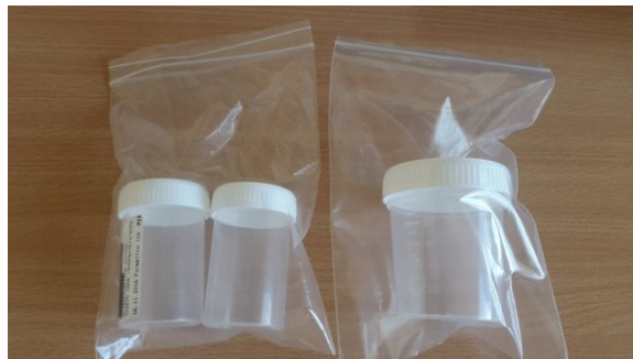
2. Histoloogiliseks uuringuks saadetavate proovimaterjalide pakendamine.