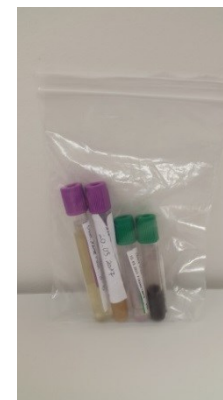
3. 1 Tsütoloogiliseks uuringuks saadetavate vedelike pakendamine.