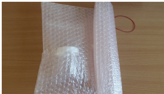
4. Pakenda minigrip-kotis olevad analüüsitopsid või transpordikarbis olevad preparaadiklaasid omakorda mullikillesse.

Eneken Helk Osakonna juhtiv bioanalüütik 617 2393