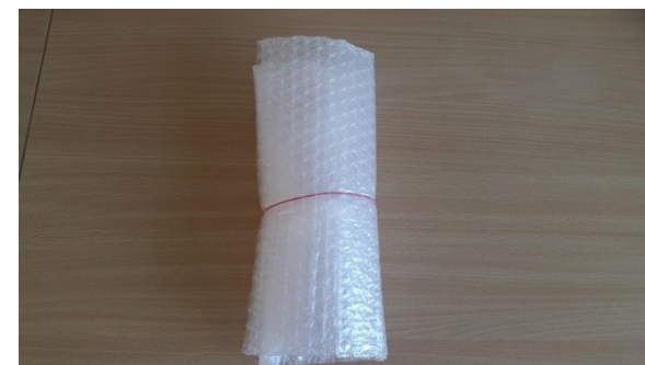
5. Kinnita mullikile kummiga ja aseta saadetus toruposti kapslisse.