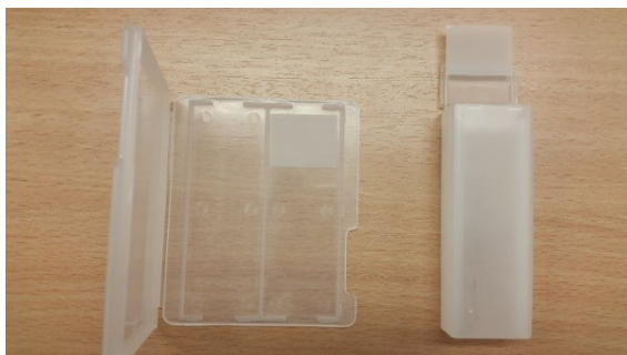
3.2 Tsütoloogiliseks uuringuks saadetavate preparaadiklaaside pakendamine.

Eneken Helk Bioanalüütik-õendusjuht 617 2393