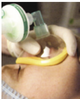
Пациент под масочным наркозом.

интравенозная регионарная анестезия – используется при небольших операциях на верхней или нижней конечности. Для проведения операции на оперируемую конечность накладывается жгут и анестетик вводится в вену оперируемой конечности. Лекарственный препарат быстро начинает оказывать свое действие, его эффект длится до тех пор, пока жгут с конечности не будет снят.